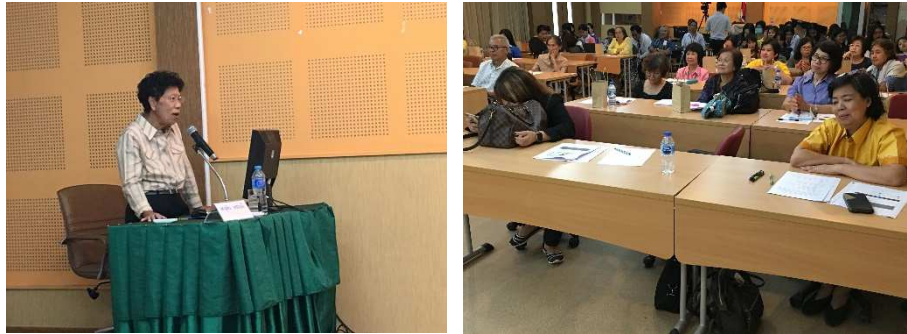
ภาพที่ 1 การบรรยายให้ความรู้เรื่องหนังสือมนุษย์