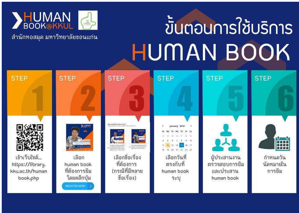
ภาพที่ 3 แสดงขั้นตอนการยืมหนังสือมนุษย์

7. ทีมงาน Human Library บันทึกสาระสำคัญของหนังสือ เพื่อนำขึ้นเผยแพร่ผ่านเว็บไซต์ (อยู่ระหว่างการดำเนินการ)