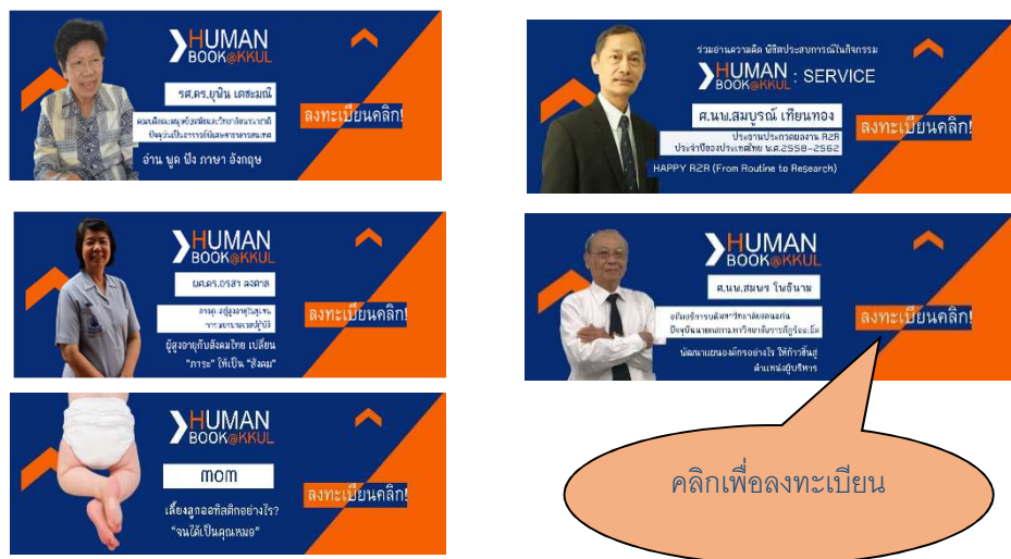
ภาพที่ 2 แสดงรายละเอียดของการเข้าลงทะเบียนยืมหนังสือมนุษย์ผ่านเว็บไซต์